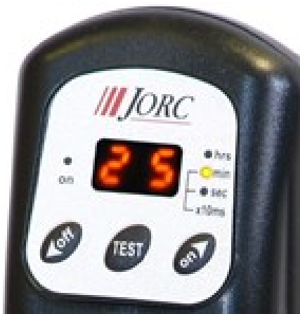
Helder verlicht display